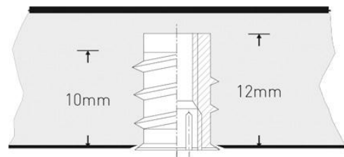
Befestigung mittels Gewindemuffe